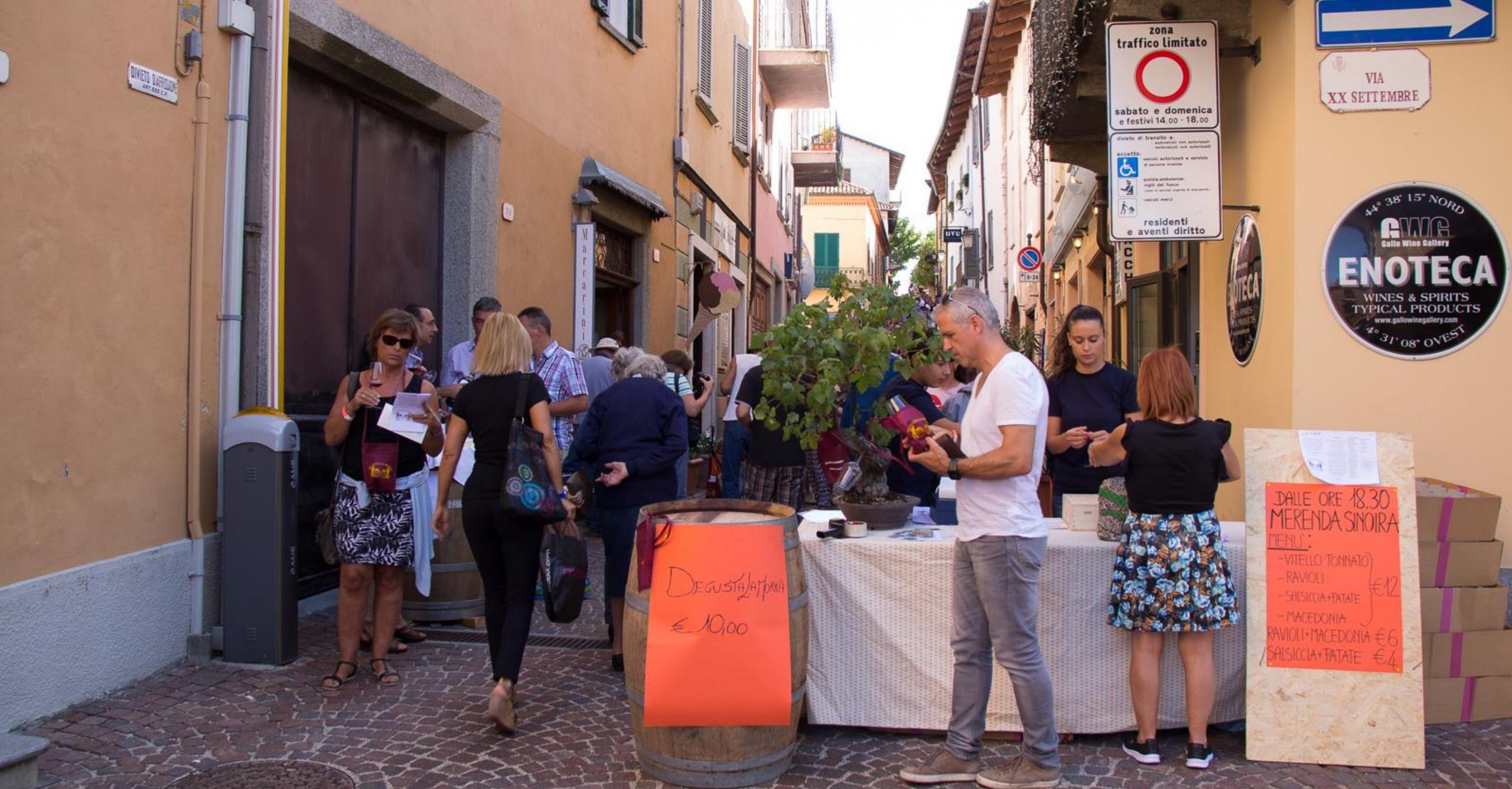
Degusta La Morra afholdes hvert år første søndag i september